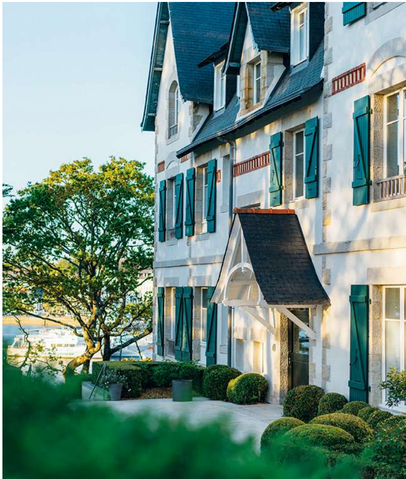
VILLA TRI MEN, SAINTE-MARINE