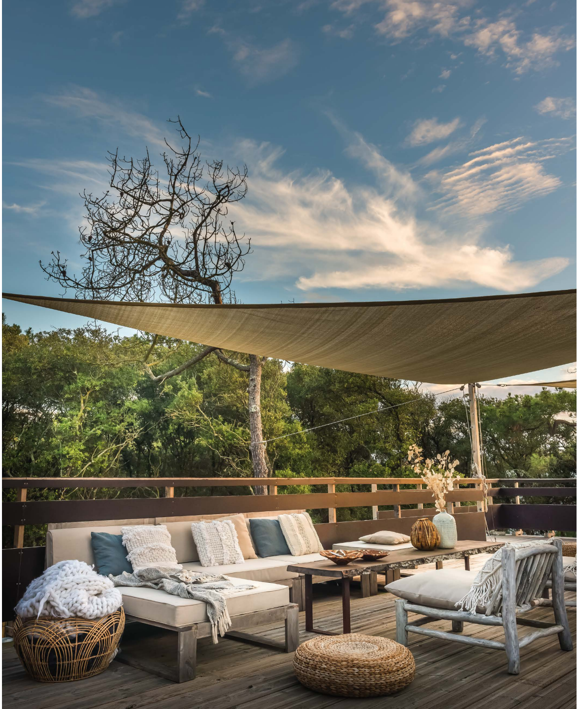
Canopée vue océan