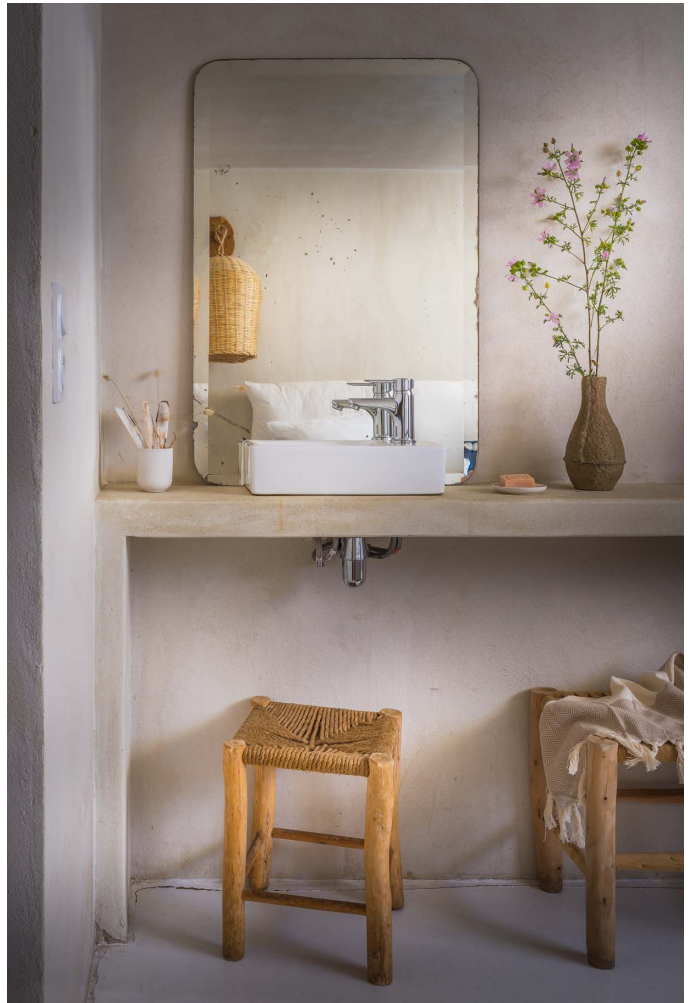
Canopée vue océan